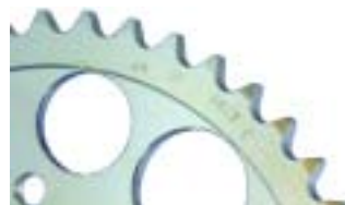
CORONA C: Acero al carbono ET-RG45