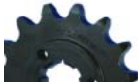
PIÑÓN K: Acero 16CrNi4