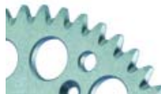
CORONA EC: Aluminio 7075T6 Anodizado plata. Anti-barro.