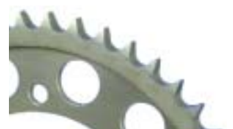
CORONA THF: Acero al carbono 16CrNi4 endurecido.