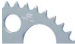
CORONA E: Aluminio 7075T6 Anodizado plata.