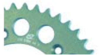
CORONA ESM: Aluminio 7075T6 Anodizado plata.