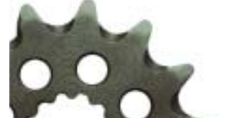
PIÑÓN KC: Acero 16CrNi4. Aligerado y rebajado anti-barro.