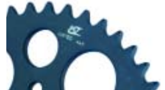
CORONA ED: Aluminio 7075T6 Anodizado duro 40 micras.