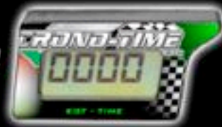
EGT - TIME THERMOMETER COD. EGT - 01