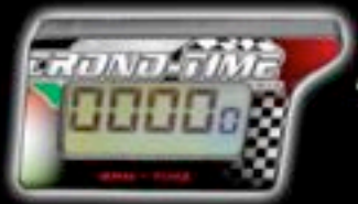
RPM - TIME ENGINE TACHOMETER COD. RT - 01