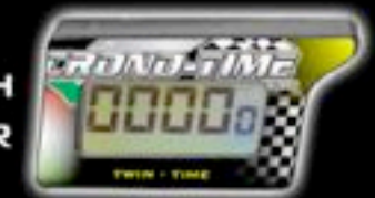
TWIN - TIME ENGINE HOUR METER WITH INTEGRATED TACHOMETER COD. TWT - 01