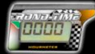
HOURLMETER ENGINE HOUR METER COD. HUR - 01